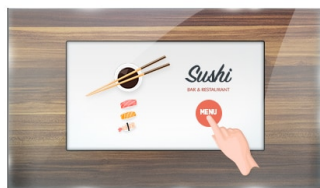
Тач через стекло

Монитор ProLite TF1015MC (10.1 дюйма) использует сенсорную технологию PCAP и выполнен в привлекательной рамке со стеклом от края до края. Благодаря стеклянной накладке, покрывающей экран, и прочной рамке, он гарантирует высокую прочность и устойчивость к царапинам, что делает его идеальным для киосков и общественных мест с высокой интенсивностью использования. Технология IPS-панели обеспечивает точную и стабильную цветопередачу с широкими углами обзора. Оснащенный пенопластовым уплотнителем, он обеспечивает бесшовную интеграцию в киоски и имеет класс защиты IP65, что позволяет защитить его от пыли и воды с лицевой стороны. Ландшафтная, портретная и лицевая ориентация обеспечивает гибкие возможности монтажа практически в любом месте. Для удобства интеграции TF1015MC может быть оснащен дополнительными внешними монтажными кронштейнами (OMK2-1), что делает его идеальным решением для интеграторов киосков, промышленных сред, диспетчерских и интерактивных мультимедиа.