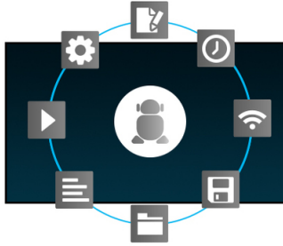
Android İşletim Sistemi

43" 4K UHD Profesyonel Digital Signage 7/24 Ekran (Yatay ve Dikey), Android OS, FailOver ve Intel® SDM slot