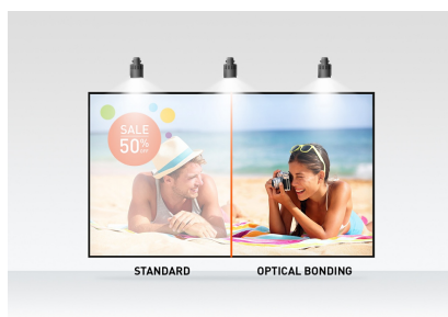
Optical bonded PCAP

Ook verkrijgbaar in het zwart : ProLite T2752MSC-B1