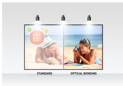
Optical bonded PCAP

Le ProLite T2755MSC avec la résolution Full HD (1920x1080) et la dalle IPS offre des couleurs exceptionnelles et de larges angles de vision. La technologie tactile PCAP (Optical Bonded Projective Capacitive) à 10 points garantit une réponse tactile transparente et précise, ainsi qu'une réflexion lumineuse réduite. Un revêtement nanométrique spécial assure un toucher plus doux et moins de résistance lors du balayage. Il rend l'écran moins statique et moins sensible à la saleté, à la poussière et aux empreintes digitales. Un choix parfait pour un large éventail d'applications.