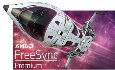
FreeSync™ Premium Technology

The Fast IPS panel technology guarantees not only high-fidelity, vivid battleground scenes displayed with outstanding colour accuracy but provides also an outstanding 0.8ms Moving Picture Response Time (MPRT).