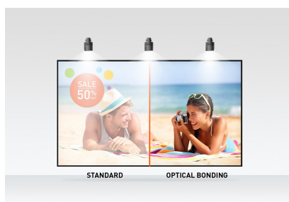
Optical bonded PCAP

Met de Optical Bonded Projective Capacitive (PCAP) 10 punts Touch-technologie levert de ProLite TF2438MSC-B1 een naadloze en accurate Touch ervaring. Deze Full HD (1920x1080) Open Frame monitor met IPS-paneeltechnologie garandeert een uitzonderlijke kleurechtheid en hoog contrast vanuit elke kijkhoek. Een robuuste metalen behuizing en krasbestendig 7H edge-to-edge glas met anti-vingerafdruk coating maken de monitor bijzonder geschikt voor integratie in veeleisende omgevingen. Bovendien voldoet de monitor aan een IPX1 beschermingswaardering, waardoor hij waterdicht is voor gedurende tijd tegen druppelend water en is de display beschermd tegen vochtigheid en mogelijke vochtontwikkeling. De ProLite TF2438MSC-B1 kan worden gebruikt in landscape, portrait and face-up oriëntatie. Een perfecte oplossing voor kiosksystemen, detailhandel en interactieve digitale signage installaties.