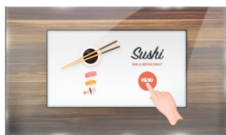
Touch durch Glas

Der ProLite T2234MSC-B1S ist ein 22" Multi-Touch-Monitor mit projektiv kapazitiver Touch-Technologie (10 kompatible Touch-Punkte) und Sicherheitsglas bis zum äußersten Rand. Ausgestattet mit einem auffallend schönen Design und einem IPS Panel mit Full HD (1920x1080) Auflösung, bietet das Gerät eine ausgezeichnete Farbwiedergabe bei großen Betrachtungswinkeln, was ihn zum perfekten interaktiven Display für Digital Signage Anwendungen macht. Analoge und digitale Eingänge bieten größtmögliche Flexibilität beim Anschluss, das Touch-Interface wird über einen USB-Steckplatz angesteuert. Dank der Touch-durch-Glas Technologie werden präzise Touch-Reaktionen auch durch eine separate Glasschicht ermöglicht. Eine IP65 Zertifizierung garantiert den Schutz vor Staub und Wasser, damit eignet sich der Monitor ganz besonders für interaktive Anwendungen.