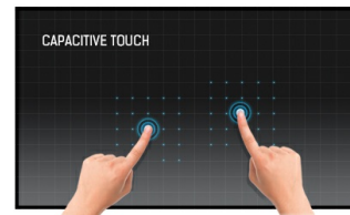
Dokunmatik teknolojisi - Kapasitif (PCAP)

Bu teknoloji, ekranı kaplayan cama entegre edilmiş mikro ince tellerden oluşan bir sensör ızgarası kullanır. İnsan parmağı camın üzerine yerleştirildiğinde sensör ızgarasının elektriksel özellikleri değişir, dokunma algılanır. Cam kaplama sayesinde bu teknoloji son derece dayanıklıdır ve cam çizilse bile dokunma işlevi etkilenmez. Mükemmel görüntü performansı sunar ve insan parmağıyla (ayrıca lateks eldivenli) ve stylus kalemle çalışır.