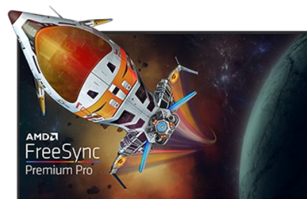
TECHNOLOGIE FREESYNC™ PREMIUM PRO

La dalle Fast IPS garantit non seulement des scènes de champ de bataille vives et de haute fidélité affichées avec une précision de couleur exceptionnelle, mais elle offre également un temps de réponse d'image en mouvement (MPRT) exceptionnel de 0.5 ms.