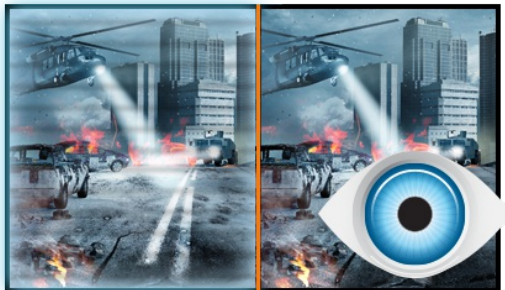
FLICKER FREE + BLUE LIGHT

ProLite X2483HSU-B2 - a 24" LED backlit LCD Screen featuring AMVA panel technology, guarantees accurate and consistent colour reproduction with wide viewing angles. Offering 24 bit 'True Colour' and great performance for displaying Black and White with the 3000:1 Native Contrast Ratio, means that the ProLite X2483HSU-B2 will provide excellent performance for Photographic, Design and Web-design. With the added support of a Low Power LED Panel, the iiyama ProLite X2483HSU-B2 is also an excellent choice for Universities, Corporate and Financial Markets.