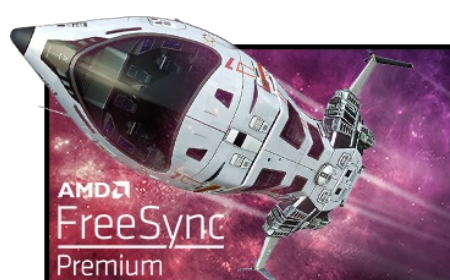
Tecnologia FreeSync™ Premium

La tecnologia del pannello Fast IPS garantisce non solo immagini vivide e ad alta fedeltà, ma le visualizza anche con un'eccezionale accuratezza dei colori e con un tempo di risposta sulle immagini in movimento (MPRT) di 0.8ms.