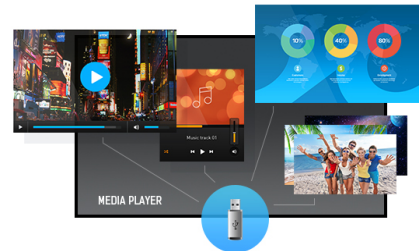
Reproductor de medios

La resolución UHD (3840x2160), más conocida como 4K, ofrece un área de visibilidad gigantesca con 4 veces más información y espacio de trabajo que una pantalla Full HD. Debido al alto DPI (puntos por pulgada), muestra una imagen increíblemente nítida.