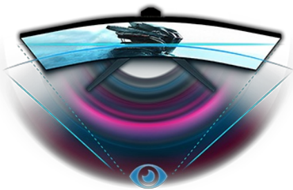
Изогнутый дизайн 1500R

Регулируемая по высоте подставка обеспечивает полную гибкость для идеального положения вашего экрана. Измените настройки экрана, используя предустановленные и настраиваемые игровые режимы, а также функцию Black Tuner для полного контроля над темными сценами и абсолютной детализации.